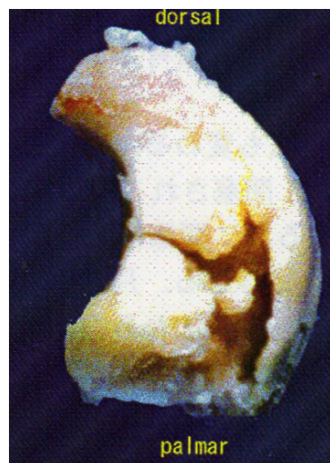
写真4：キーンベック病月状骨摘出標本